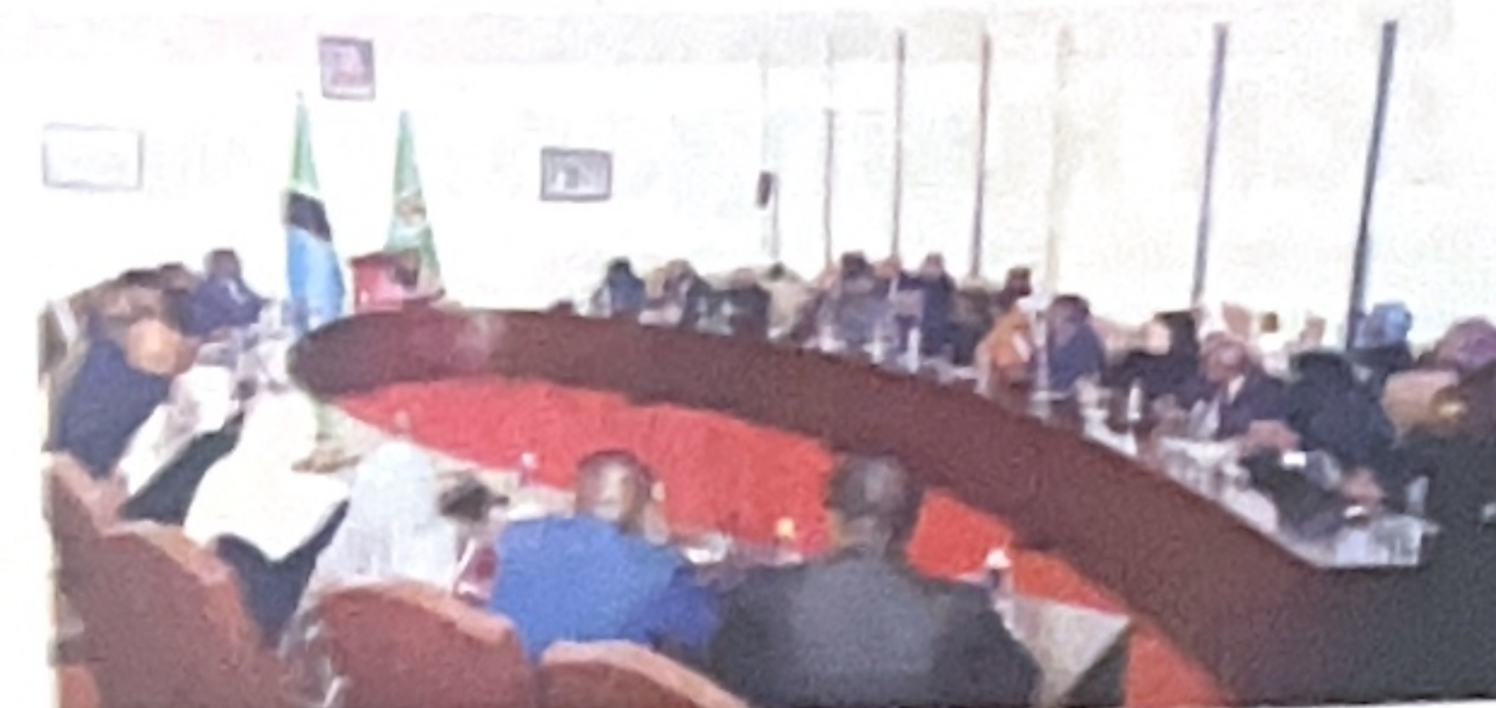
Waziri Mkuu, Dk Mwigulu Nchemba akiwasilisha makadirio ya mapato na matumizi ya ofisi yake kwa mwaka wa fedha 2026/2027, bungeni, jijini Dar es Salaam jana.

Baada ya 2011, kasi ya ongezeko la bei ilitazwa kupungua. Ikiashiria kipin- di cha mptio wa kiasi hadi mwaka 2012, hatua hiyo iliyowasababisha viwango vya bei yaliyabaki juu.