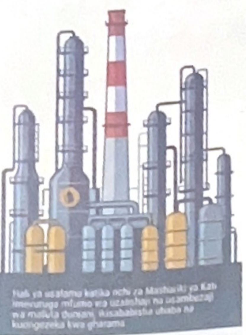
Hali ya usafiri katika nchi za Mashariki ya Kati imerutopwa mifumo wa usafirishaji wa mafuta...