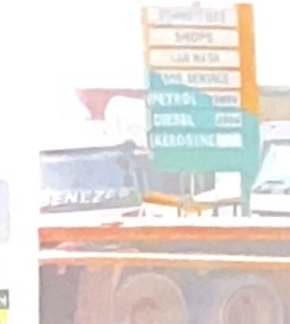
Majari yakwa yamegeshwa kwenye Kituo cha Mafuta cha Camel Tabata, Dar es Salaam huku bango la bei ya mafuta liki-onyesha kupanda kwa rishati hyo.