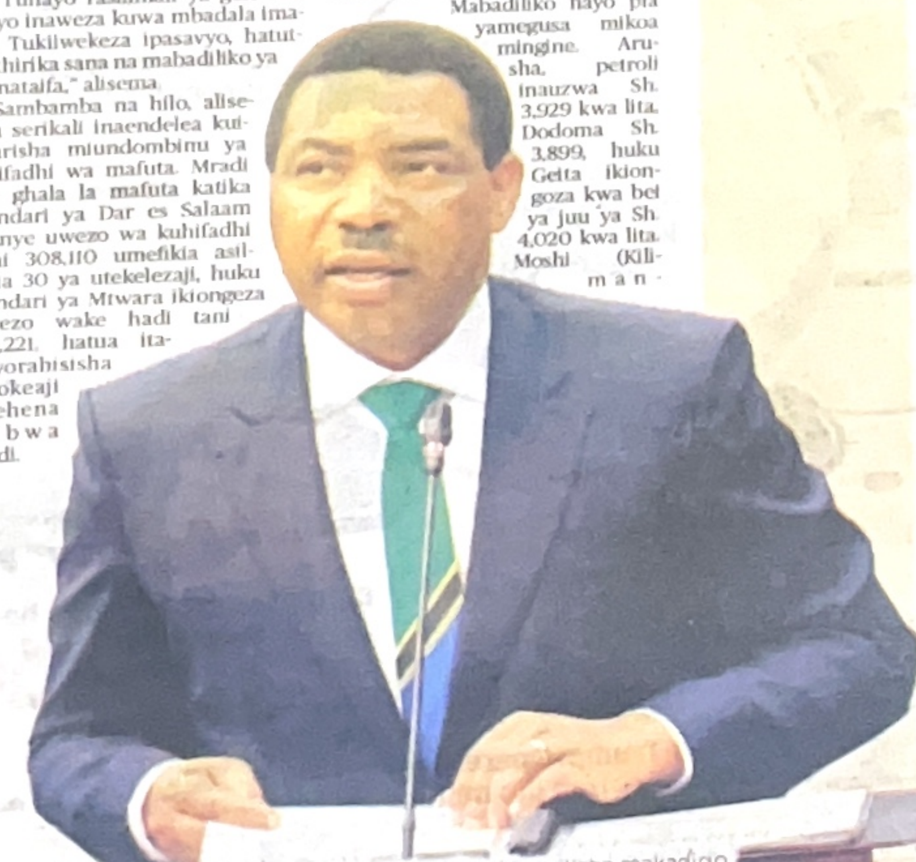
Waziri Mkuu, Dk Mwigulu Nchemba akiwasilisha makadirio ya mapato na matumizi ya ofisi yake kwa mwaka wa fedha 2026/2027, bungeni, jijini Dodoma jana.